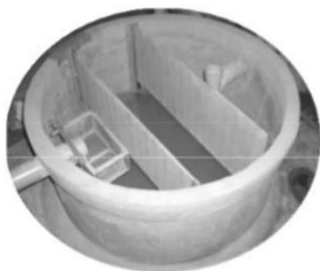
ตัวอย่างบ่อดักไขมันวงขอบซีเมนต์

๑. บ่อดักไขมันแบบวงขอบซีเมนต์ การติดตั้งใช้งานเหมาะสมกับบ้านเรือนทั่วไปและสถานประกอบการที่มีขนาดเล็ก โดยประยุกต์ใช้วงขอบซีเมนต์สำเร็จรูปมาทำเป็นบ่อดักไขมันได้ การติดตั้งฝังไว้บนพื้นดินหรือใต้ดินและเก็บกับน้ำเสียได้อย่างน้อย ๖ ซม.