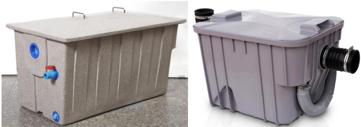
ภาพที่ ๔ ถังดักไขมันสำเร็จรูปแบบต่าง ๆ