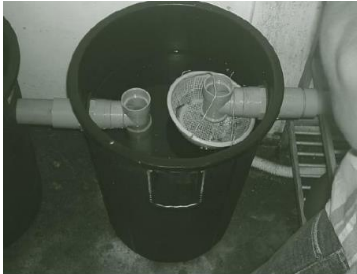
ภาพที่ ๒ ถักดักไขมันอย่างง่าย

๓. บ่อดักไขมันอย่างง่าย เป็นถักดักไขมันแบบภูมิปัญญาชาวบ้านที่ประดิษฐ์ใช้ได้เองในครัวเรือน โดยใช้วัสดุที่หาง่ายในท้องถิ่น ตัวอย่างถักดักไขมันอย่างง่าย ได้แก่ ถักดักไขมันแบบนำถังมาประยุกต์ใช้ เป็นถักดักไขมันอย่างง่ายและประหยัดใช้กับบ้านเรือน