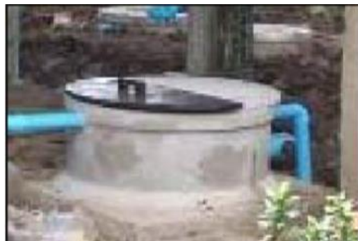
ภาพที่ ๑ บ่อดักไขมันแบบใช้วงขอบซีเมนต์สำหรับที่พักอาศัย