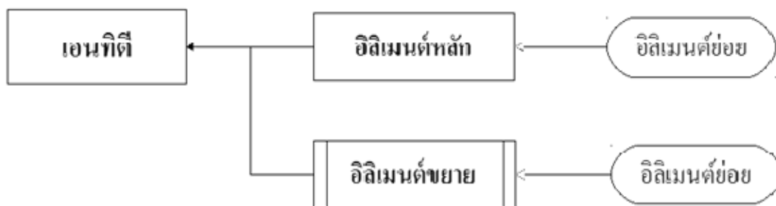
รูปที่ 1 ความสัมพันธ์ของชุดอีลิเมนต์ในเอนทิตี

โครงสร้างของชุดอีลิเมนต์ที่กำกับคุณสมบัติของเอนทิตี ประกอบด้วย อีลิเมนต์หลัก อีลิเมนต์ขยาย และอีลิเมนต์ย่อย โดยมีความสัมพันธ์ของอีลิเมนต์ทั้ง 3 ประเภท ดังแสดงในรูปที่ 1