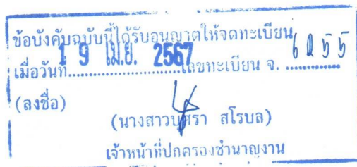
(ดร. เอกวีร์ ไวยูร์เกียรติ)

ข้อ 39. เมื่อสมาคมได้รับการอนุญาตให้จดทะเบียนให้เป็นนิติบุคคลทางราชการ ก็ให้ถือว่าผู้เริ่มก่อตั้งสมาคมทั้งหมดเป็นสมาชิกสามัญและรักษาการในตำแหน่งนายกสมาคมและกรรมการบริหารของสมาคม เพื่อรับสมัครสมาชิกและเมื่อรับสมัครสมาชิกสามัญได้จำนวนพอสมควร ก็ให้จัดให้มีการประชุมใหญ่ขึ้น เพื่อเลือกคณะกรรมการบริหารชุดแรกของสมาคม ทั้งนี้จะต้องดำเนินการจัดประชุมใหญ่ให้เสร็จสิ้นภายใน 2 ปี นับตั้งแต่สมาคมได้รับการอนุญาตให้จดทะเบียนให้เป็นนิติบุคคล