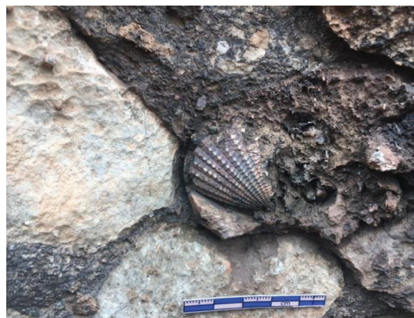
รูปถ่ายซากดึกดำบรรพ์แบรคิโอพอด (Brachiopod)