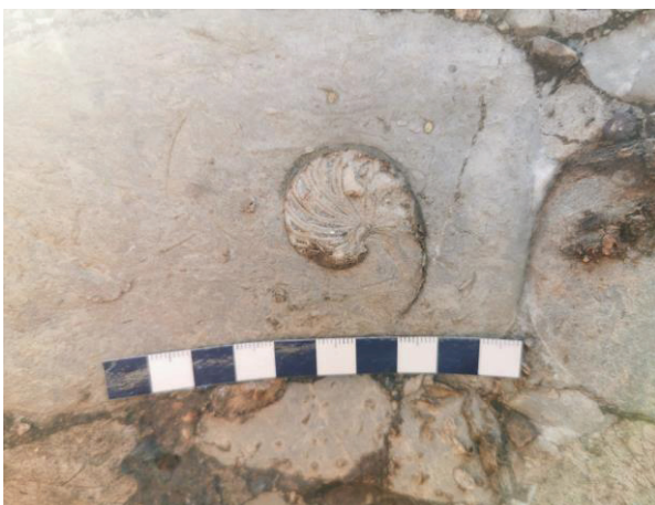
รูปถ่ายซากดึกดำบรรพ์แอมโมนอยด์ (Ammonoid)