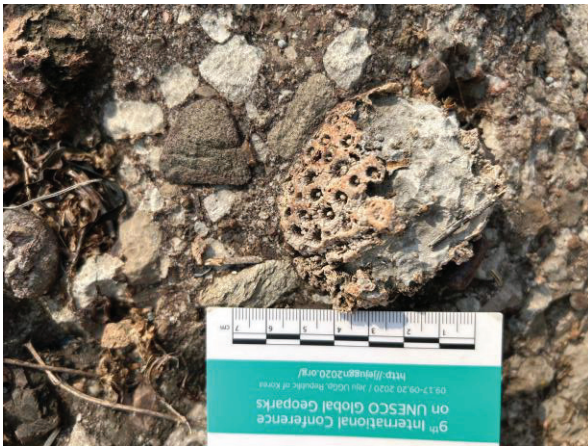
รูปถ่ายซากดึกดำบรรพ์ปะการัง (Coral)