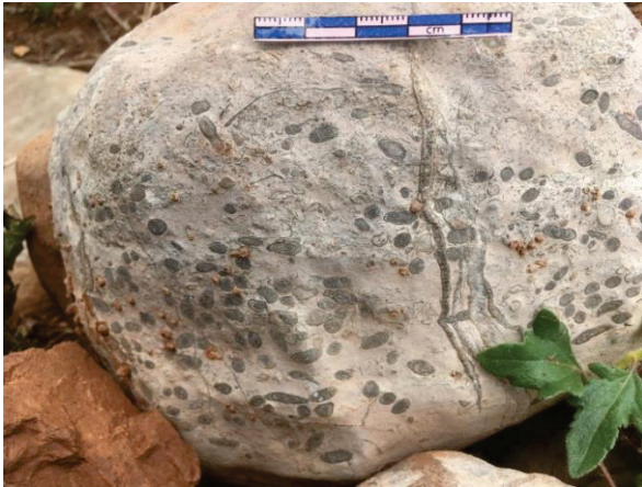
ซากดึกดำบรรพ์ฟิวซูลินิด (Fusulinid)