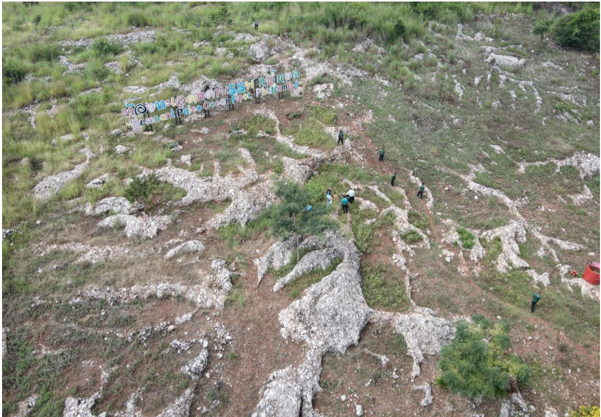
รูปถ่ายมุมสูงบริเวณแหล่งซากดึกดำบรรพ์สัตว์ไม่มีกระดูกสันหลังภูน้ำหยด