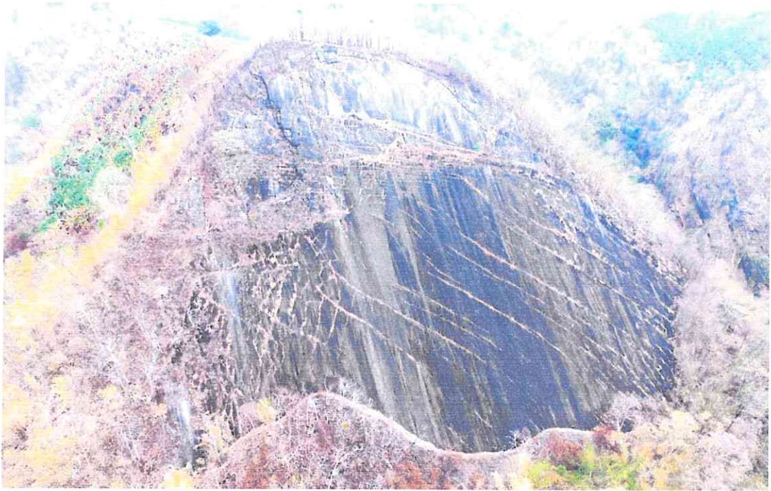
รูปถ่ายมุมสูงหน้าผาที่พรอยตีนอาร์โคซอร์น้ำหนาว อำเภอน้ำหนาว จังหวัดเพชรบูรณ์