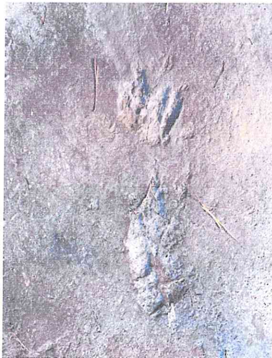
รูปพิมพ์รอยตีนอาร์โคซอร์