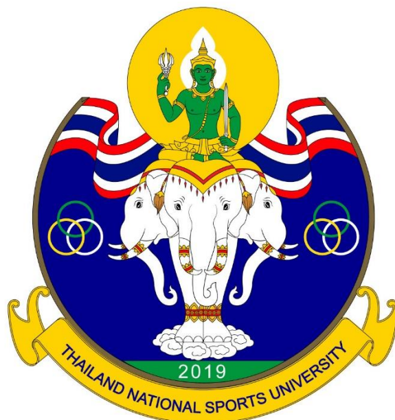
KHON KAEN SPORTS SCHOOL