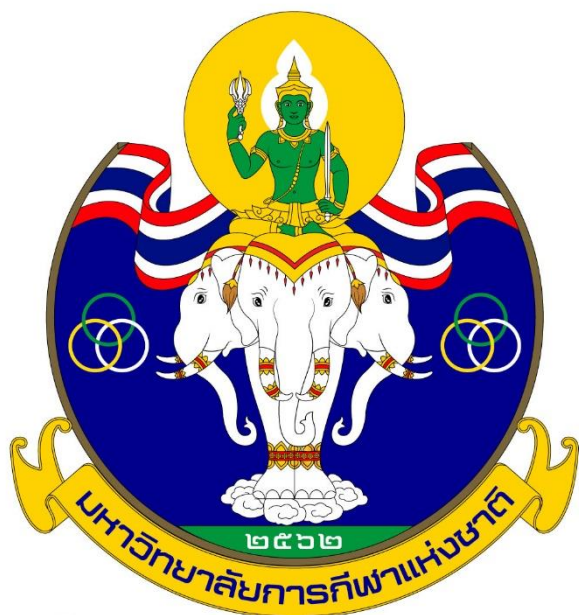
โรงเรียนกีฬาจังหวัดขอนแก่น