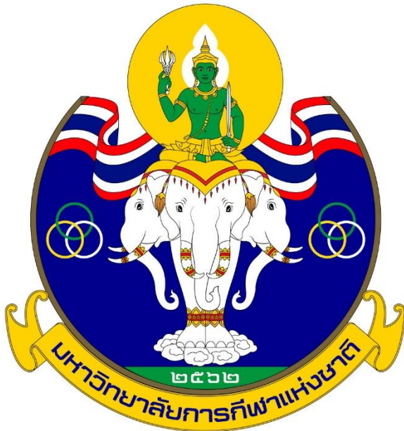
ประจำภาคเหนือ