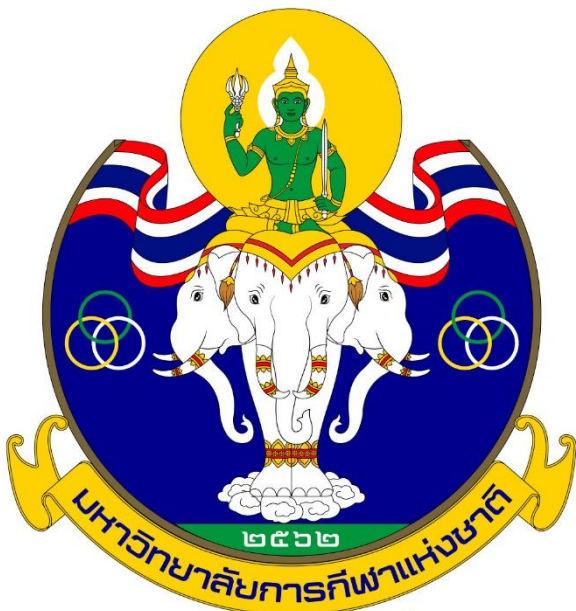
วิทยาเขตกระบี่